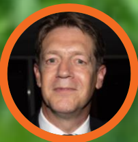
Just Spee (terugtreidend) Bondsvoorzitter